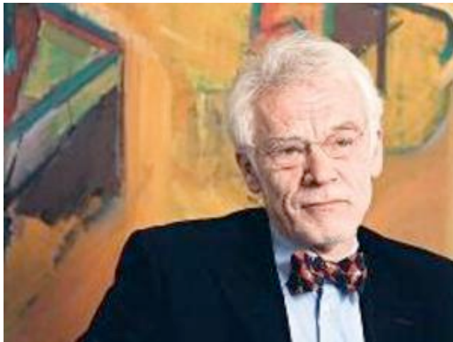
Bildungssenator Jürgen Zöllner

Jürgen Zöllner will nach der Sommerpause ein umfassendes Qualitätspaket vorlegen. Schulen und Kitas sind sich einig: Anfangen sollte der Senator bei der rechtzeitigen und ausreichenden Bereitstellung des Personals.